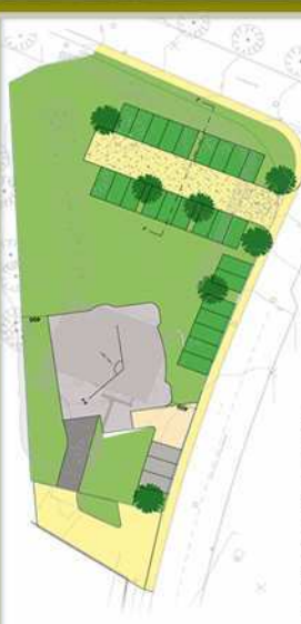
Vue d'ensemble du projet

- Paroles du Prophète, Paix et Salut soient sur Lui -